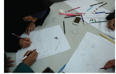
Mener des recherches-actions