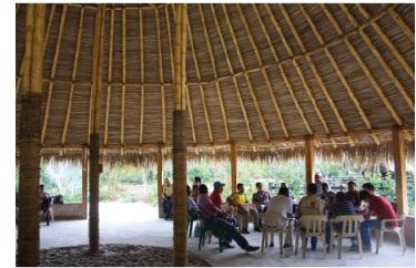
Engager la communauté