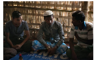
Redéfinir les rôles