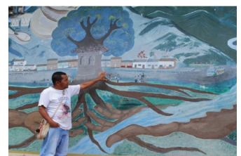
Intérêts réels pour le long terme