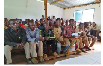
Meilleur accès aux communautés