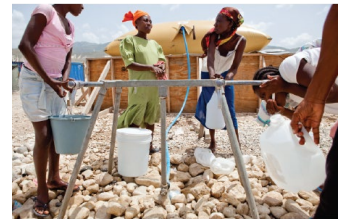
Comprendre le contexte local