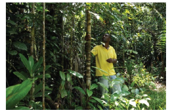
Aperçu des environnements instables