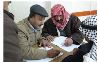
Relation de confiance avec les acteurs locaux